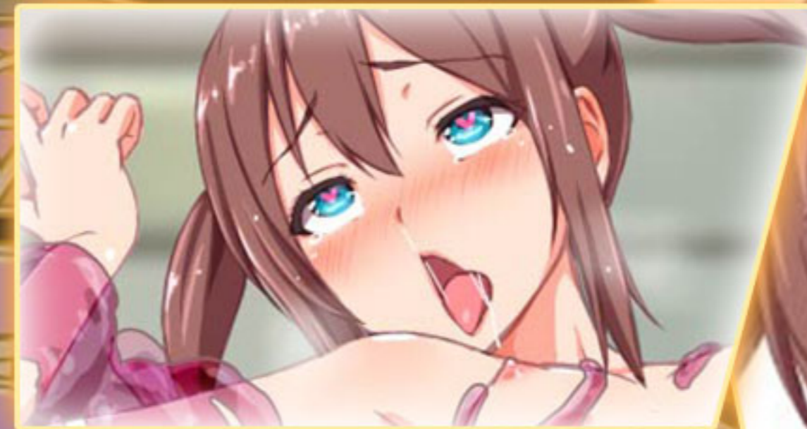
ハヤトリ 早鳥 かるた

ボドゲ部のマスコットの存在 天真爛漫なトラブルメーカー 率先して悲惨な目に合いながらも 前向きな姿勢で一同を引っ張る