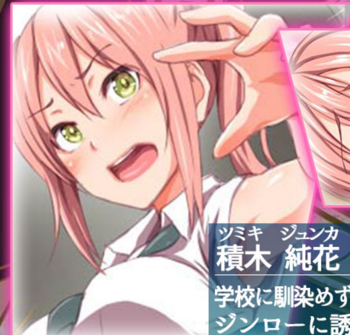
ツミキ ジュンカ 積木 純花

学校に馴染めず、一時は不登校気味だったが ジンローに誘われボドゲ部に入部、 居場所ができ学校に来るようになった ジンローに想いを寄せている